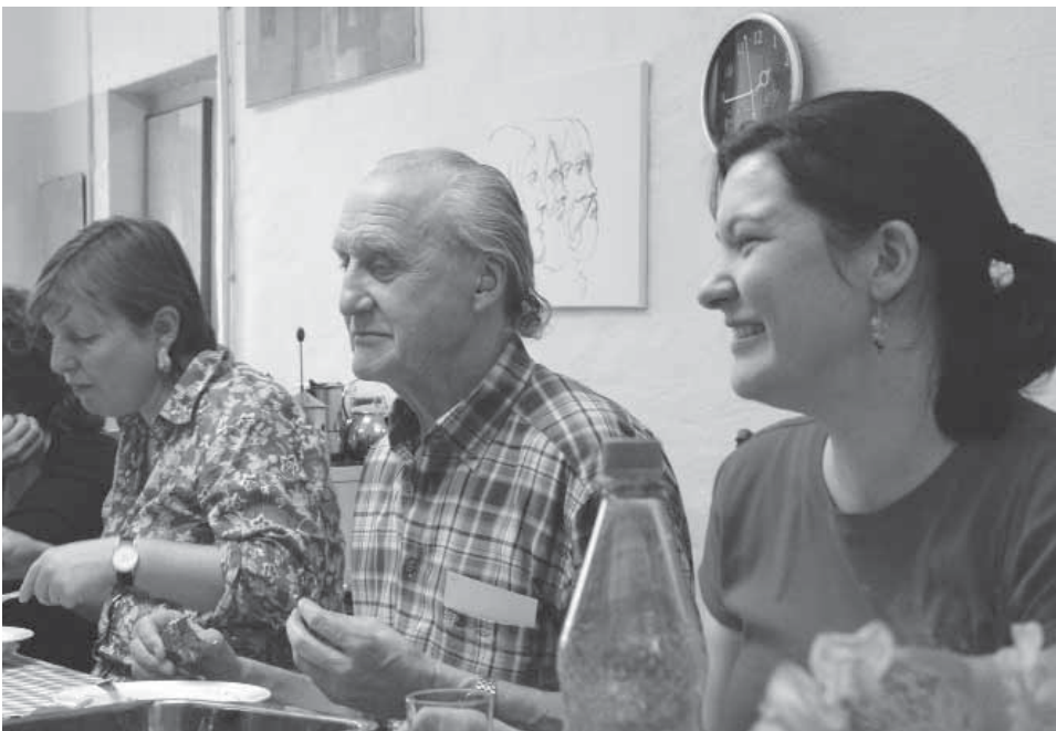
Gemeinsam macht's mehr Spaß

Die altersgerechte Quartiergestaltung nach dem Konzept WohnQuartier 4 kann zu einer Ausweitung von Teilnahme und Teilhabe, zu einer Rückgewinnung nachbarschaftlicher Strukturen, zu neuen Netzwerken und Kooperationen im Quartier führen. Damit kann die „Ertüchtigung“ der Quartiere für den demografischen Wandel insgesamt und die möglichst lange selbstbestimmte Lebensführung der einzelnen Bewohnerinnen und Bewohner maßgeblich befördert werden. Perspektivisch ist die Erweiterung der Zielstellung „altersgerecht“ hin zu „inklusiven“ Quartieren anzustreben, also die Ermöglichung eines möglichst selbstbestimmten Lebens und größtmöglicher gesellschaftlicher Teilhabe für alle Menschen mit individuellen (körperlich, geistigen, seelischen) Beeinträchtigungen und unterschiedlichen Graden an Unterstützungsbedarf.