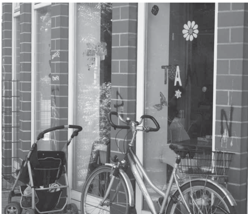
Treffpunkt für Jung und Alt